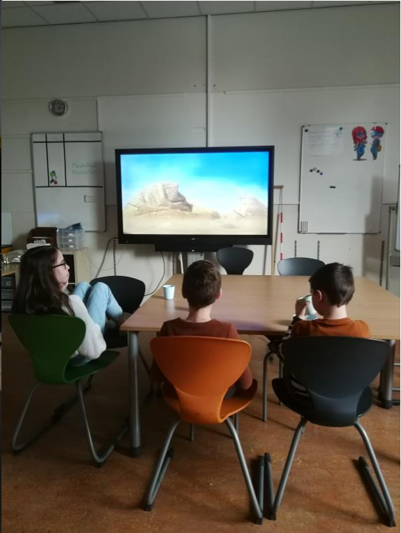
Samen een filmpje kijken.