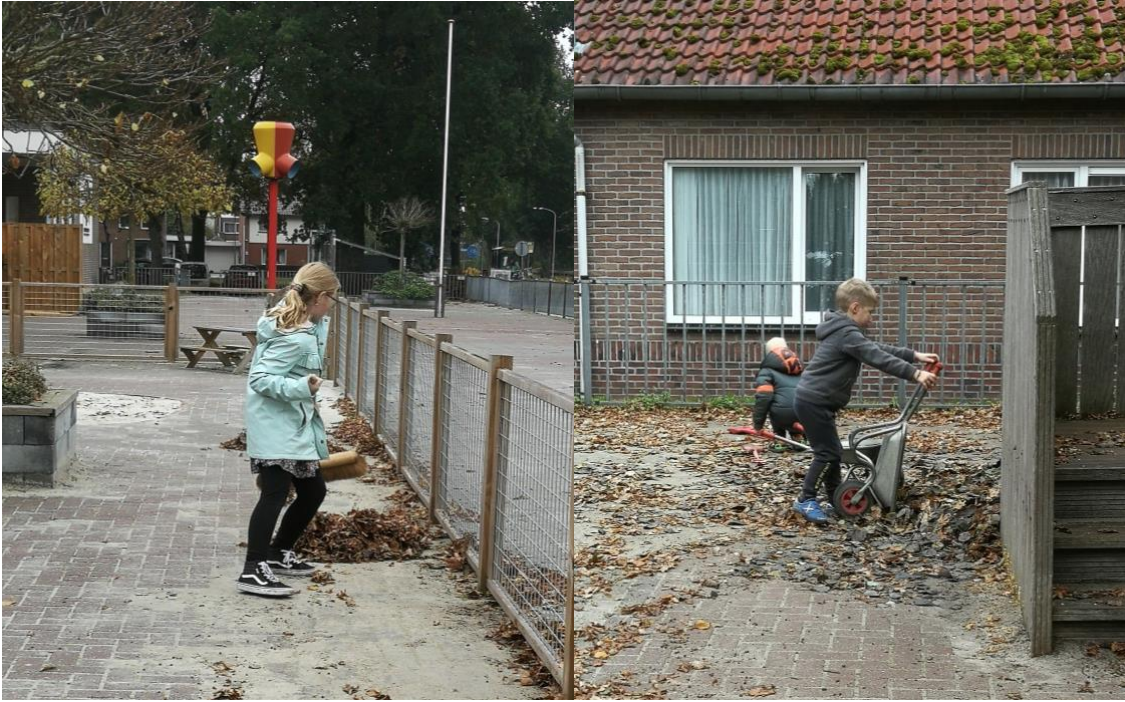
In de herfstvakantie was er ook opvang en dan is er ook eens tijd voor andere dingen: